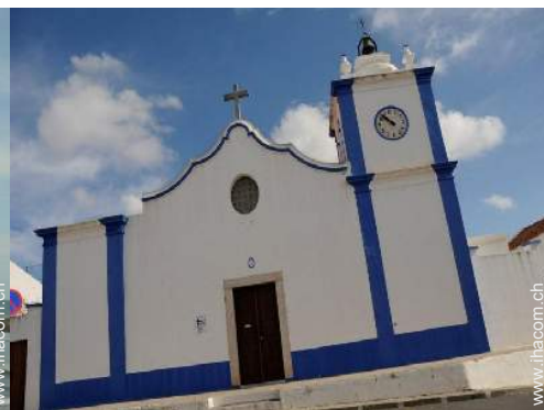
Attraktionen und Entspannung